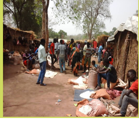
سوق يابوس النيل الأزرق (مارس 2021)