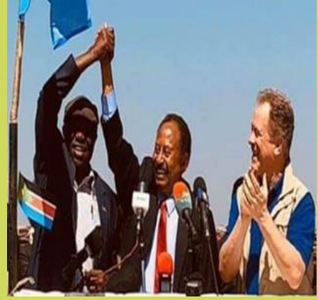
SPLM-N faction leader Abdelaziz Al Hilu and Sudan's Prime Minister Abdallah Hamdok hold their hands in Kauda, as WFP chief David Beasley looks on.